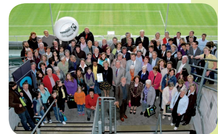
Dortmund war die dritte Fairtrade-Stadt in Deutschland