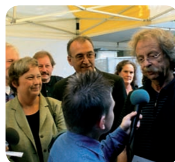
Zahlreiche Prominente unterstützen Fair Trade, z.B. Marie-Luise Marjan, Norbert Blüm, Heidemarie Wiczorek-Zeul, Sportfreunde Stiller, Bärbel Höhn und Jean Pütz