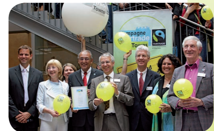
Auszeichnung in Neuss