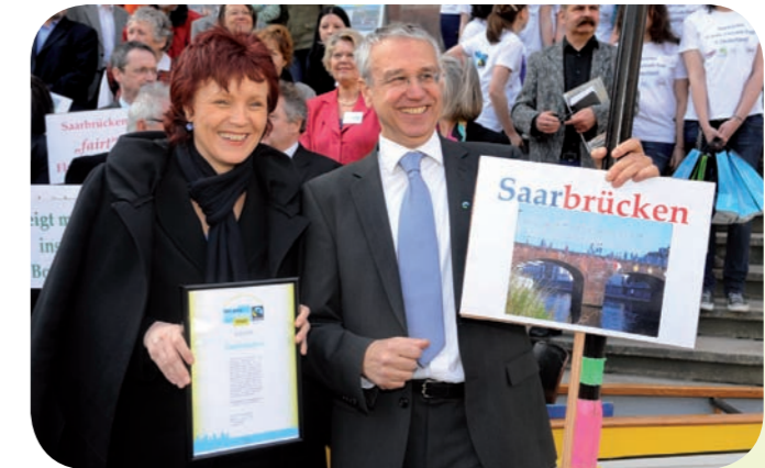
Titelverleihung an die erste Fairtrade-Stadt in Deutschland: Saarbrücken

CHECK OUT: Bitte Presseberichte und Fotos sowie wichtige Daten und Beobachtungen, die den Markt, die Verbraucher, regionale Potenziale, eigene Aktivitäten, usw. betreffen, an TransFair schicken. So sind wir in der Geschäftsstelle immer auf dem neuesten Stand, was in den Städten, Kreisen und Gemeinden passiert.