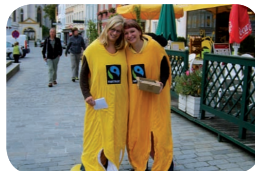
Aktionen der Steuerungsgruppen in Schweden und Österreich