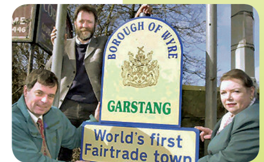
Garstang in Großbritannien war die erste Fairtrade Town weltweit und feierte 2010 ihren 10. Geburtstag.