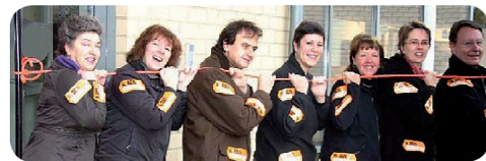
Steuerungsgruppe in Holsbeek, Belgien

Auf dem Weg zur Fairtrade-Stadt kommen Nachbarn, Interessengruppen, Wirtschaftsvertreter und Gemeindevertreter zusammen, um gemeinsam an einem Ziel zu arbeiten. Eine Fairtrade-Stadt zu werden bedeutet viel Engagement, viel Spaß und eine tolle Möglichkeit, Menschen zusammen zu bringen, die an der Zukunft ihrer Stadt mitarbeiten wollen.