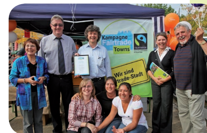
Marburg wurde am 20.09.09 im Rahmen der Fairen Woche ausgezeichnet

AM ZIEL: Nach Erfüllung aller Kriterien und Prüfung durch TransFair e.V. wird der Titel „Fairtrade-Stadt“ (bzw. Gemeinde/Kreis) für zunächst zwei Jahre vergeben. Danach erfolgt eine Überprüfung, ob die Kriterien weiterhin erfüllt sind.