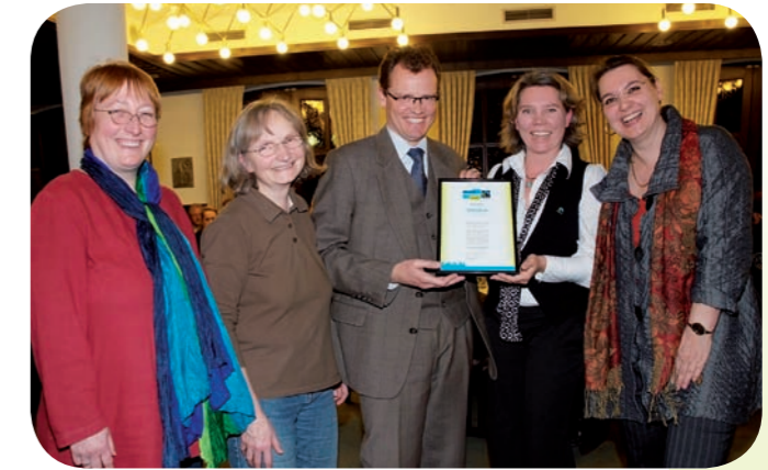
Auszeichnung von Dinslaken am 5.11.2009

Es bietet sich an, einen Aufgabenspeicher nach folgendem Muster anzufertigen. Ein solcher Aufgabenspeicher dient der Transparenz des Planungsprozesses und der Überprüfung der Einhaltung der übernommenen Aufgaben.