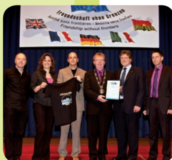
Auszeichnungen von Herrsching am Ammersee, Wolfsburg, Abensberg und Viernheim