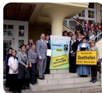
Auszeichnungen in Neumarkt, Castrop-Rauxel, Rumbach, Sonthofen